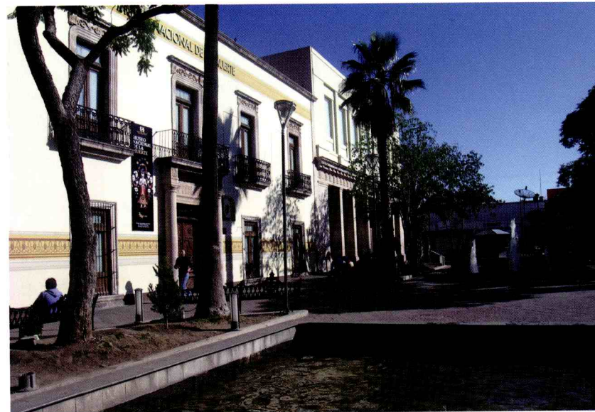
Edificio J. Jesús Gómez Portugal, Museo Nacional de la Muerte, Aguascalientes, México.