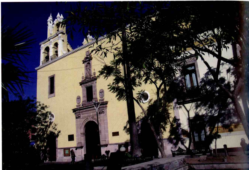
Claustro de San Diego, Aguascalientes, México.