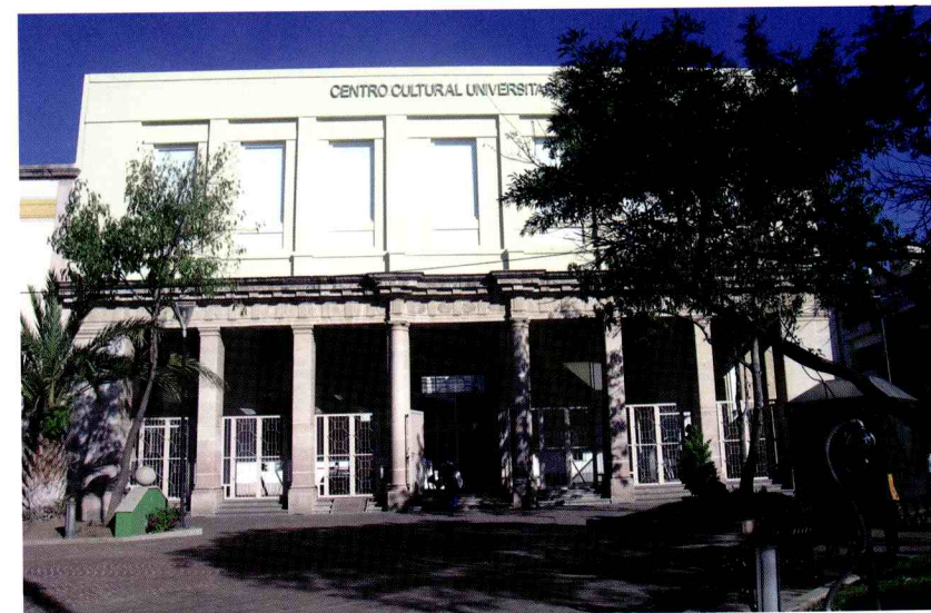
Edificio 19 de Junio, Centro Cultural Universitario, Aguascalientes, México.