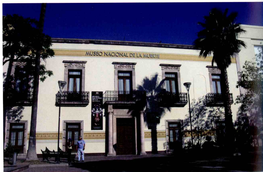
Edificio J. Jesús Gómez Portugal, Museo Nacional de la Muerte, Aguascalientes, México.