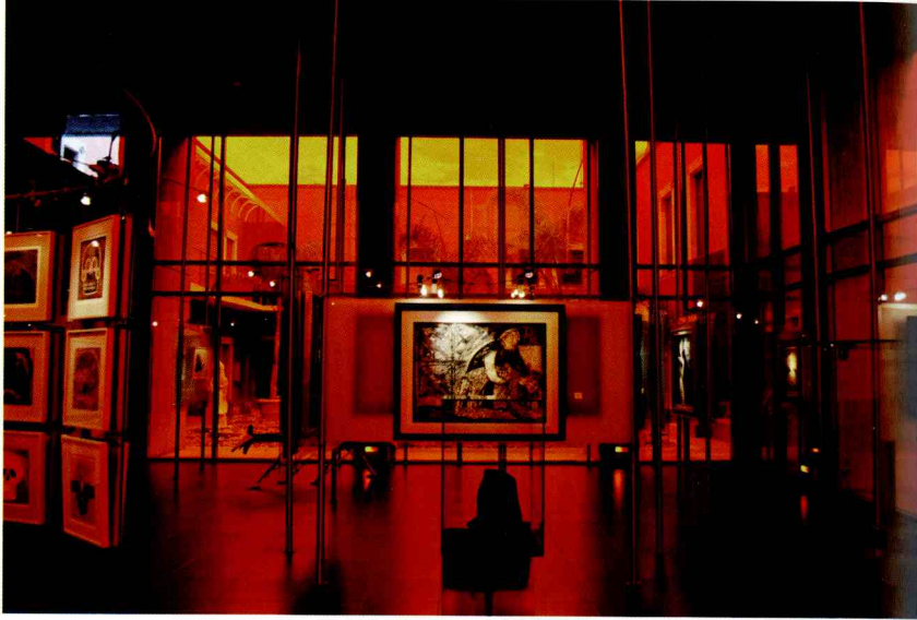
Medias Cúpulas en San Diego, Aguascalientes, México.