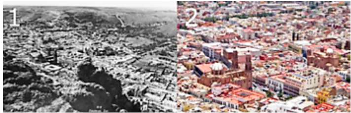
Fig. 2.- (1) Vista panorámica de la ciudad de Zacatecas (ca. 1905) Fototeca del estado de Zacatecas Pedro Valtierra. (2) Vista panorámica de la ciudad de Zacatecas (2018) https://multipress.com.mx/turismo/zacatecas-crece-en-el-ambito-turistico-durante-2018/attachment/panoramica-ciudad-de-zacatecas/ .

Zacatecas ha sido mayormente, durante su historia, una ciudad minera, por lo que, la mayoría de las actividades son desarrolladas a su alrededor; no tuvo un desarrollo grande en infraestructura en los primeros siglos después de su fundación, se pueden resumir en obras para el acarreo del agua hacia fuentes públicas y equipamiento urbano en el ámbito religioso como es la catedral y algunos otros puntos de reunión religiosa. Fue hasta entrado el siglo XIX que se inició con la construcción de obra pública. Durante el comienzo de este periodo se