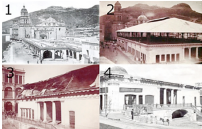
Fig. 4.- (1) Antiguo mercado de la ciudad (ca. 1880) Fototeca del estado de Zacatecas Pedro Valtierra. (2) Vista del mercado González Ortega (ca. 1900) Fototeca del estado de Zacatecas Pedro Valtierra. (3) Mercado González Ortega durante el incendio (1901) Fototeca del estado de Zacatecas Pedro Valtierra. 4. Mercado González Ortega después de su reconstrucción (s.f.) Fototeca del estado de Zacatecas Pedro Valtierra.

dades de material inflamable, que ocasionaron la desgracia. En un inicio con pocas flamas, posteriormente el fuego tuvo proporciones inmensas e hizo que el techo del piso superior se desplomara hacia los niveles inferiores, reduciendo el edificio a escombros, ya que las columnas debido a las altas temperaturas del fuego se derritieron y algunas otras se vinieron abajo. Para el mediodía, el mercado se encontraba totalmente destruido.