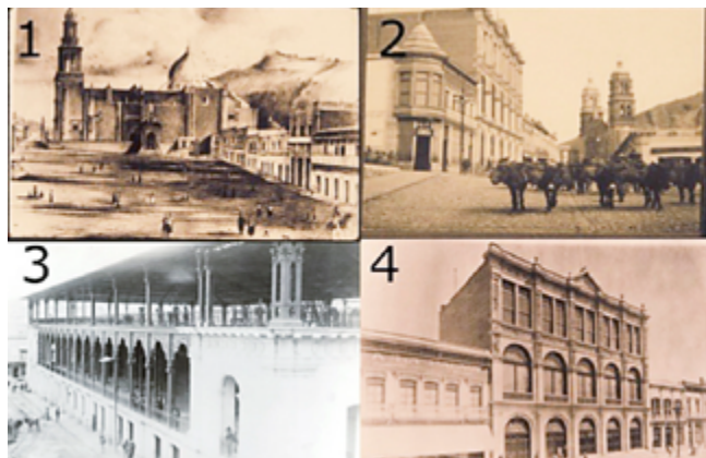
Fig. 3.- (1) Litografía de la zona donde se construyó el mercado (s.f.) Fototeca del estado de Zacatecas Pedro Valtierra. (2) Vista del teatro Calderón y del mercado González Ortega, (ca. 1906) Fototeca del estado de Zacatecas Pedro Valtierra. (3) Mercado González Ortega antes del incendio (ca. 1895) Fototeca del estado de Zacatecas Pedro Valtierra. (4) Fachada del teatro Fernando Calderón (ca. 1900) Fototeca del estado de Zacatecas Pedro Valtierra.

Ya entrado el siglo XX se dio un auge en inversión pública para el mejoramiento de edificios gubernamentales, con la creación de Ciudad Administrativa y la construcción del Campus Siglo XXI de la UAZ; también se hicieron mejoras en rubros como el carretero con pasos a desnivel y ampliación de tramos hacia distintos puntos del país como San Luis Potosí, Saltillo y Fresnillo.