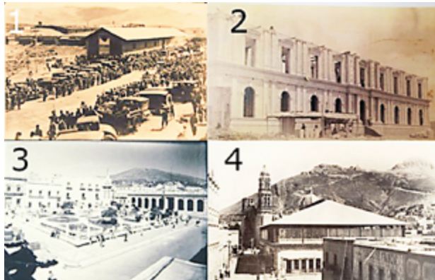
Fig. 1.- (1) Llegada del ferrocarril a Zacatecas (1883) Fototeca del estado de Zacatecas Pedro Valtierra. (2) Construcción del hospital, ahora Instituto Zacatecano de Cultura (1890) Fototeca del estado de Zacatecas Pedro Valtierra. 3. Remodelación del Jardín Independencia (ca. 1910) Fototeca del estado de Zacatecas Pedro Valtierra. (4) Mercado González Ortega, Teatro Calderón (izq.) y Catedral de Zacatecas (detrás) (ca. 1900) Fototeca del estado de Zacatecas Pedro Valtierra.