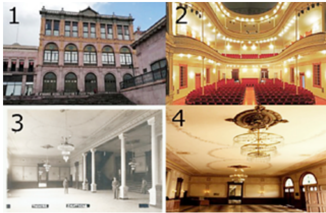
Fig. 7.- (1) Fachada del teatro Calderón (2020) cortesía https://www.elsoldezacatecas.com.mx/cultura/teatro-fernando-calderon-reabrira-sus-puertas-hasta-el-2021-zacatecas-cultura-teatro-covid-19-arte-pandemia-cancelacion-5696243.html (2) Interior del teatro Calderón (s.f.) cortesía https://zacatecasmeetings.com/contenidos/teatro-fernando-calderon/ (3) Espacio interior del teatro Calderón (s.f.) Fototeca del estado de Zacatecas Gerardo Valtierra (4) Acceso principal al teatro Calderón (s.f.) https://www.mexicoescultura.com/recinto/52060/teatro-fernando-calderon.html .

apostrofa en uno de sus poemas; desempeñó en Zacatecas, posteriormente, diversos cargos políticos 7 .