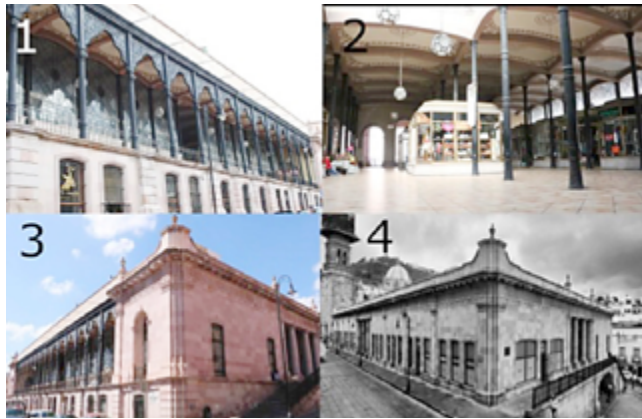
Fig. 5.- Imágenes actuales del Mercado González Ortega. (1) Fachada Oriente (2020) https://www.bestmex.com/es/mexico-seguros-blog/feria-nacional-de-zacatecas/zacatecas-mercado-gonzalez-ortega-2/ (2). Interior del mercado (2022) https://ntrzacatecas.com/temas/mercado-gonzalez-ortega/ 3. Esquina Norte-Oriente (2020) Facebook Secretaría de Turismo de Zacatecas. 4. Esquina Sur-Poniente (s.f.) https://www.pinterest.com.mx/pin/31187434292231271